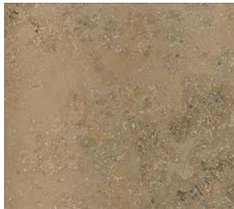
Beiger Jura Liesberger Kalkstein