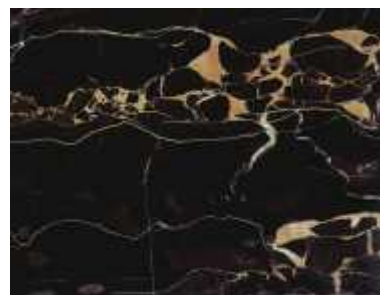
Portaro Italienischer Marmor

Kalkgesteine sind nicht säurebeständig. Diese Gesteine sollten regelmässig gereinigt und mit einer öl- und wasserabstossenden Imprägnierung behandelt werden. Diese Kalkgesteine können auch kristallisiert werden (siehe Kristallisation).