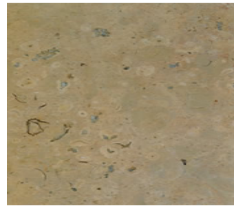
Deutscher Jura Deutscher Kalkstein