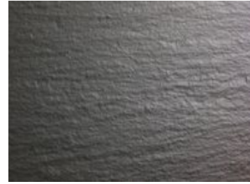
Ardesia Nera Brasilianischer Schiefer

Vorsicht: Nicht alle Schiefergesteine sind säurebeständig. Wir empfehlen beim Kauf von Schiefer dringend die genaue Herkunft und Säurebeständigkeit abzuklären.