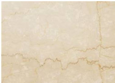
Botticino Classico Italienischer Kalkstein