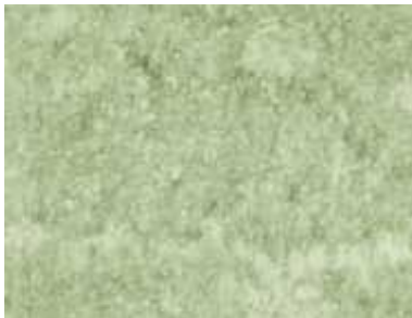
Verde Spluga Schweizer und Italienischer Gneis