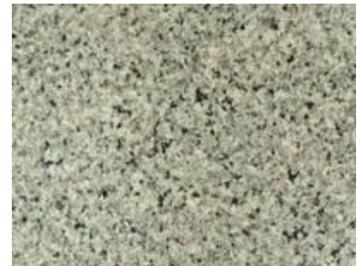
Grimsel Schweizer Granit