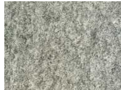
Onsernone Italienischer Gneis

Die meisten Hartgesteine sind säurefest und pflegeleicht. Trotzdem sollten auch diese Gesteine regelmässig gereinigt oder auch imprägniert werden (siehe Imprägnieren).