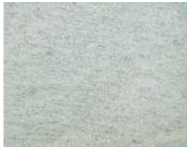
Beola Bianco Italienischer Gneis