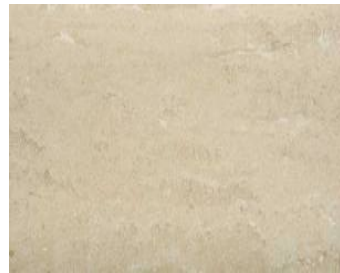
Travertin hell Italienischer Travertin