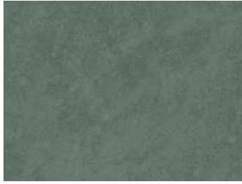
Jade Grey Brasilianischer Schiefer