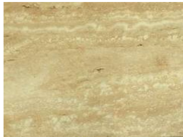
Travertin Italienischer Travertin