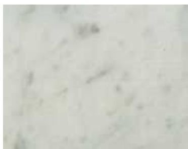
Bianco Carrara Italienischer Marmor