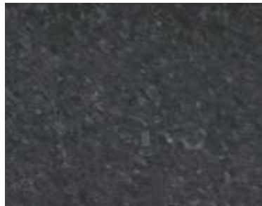
Black Pearl Indischer Granit