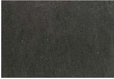
Brazil Black Brasilianischer Schiefer