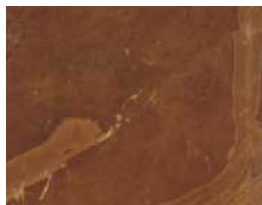
Rosso Coleman Italienischer Marmor