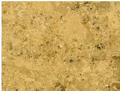
Gelber Jura Liesberger / Laufner Kalkstein

Weichgesteine: Werden auch als Kalkgesteine bezeichnet. Wir finden z.B. den Jurakalkstein aus verschiedenen Regionen.